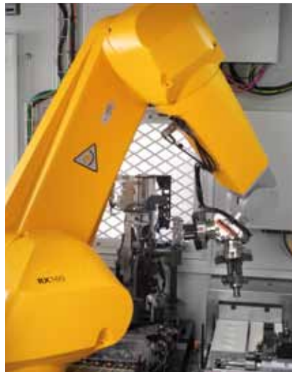
Doppelgreiferkopf, Nachmessstation, SPC und NIO Schubladen