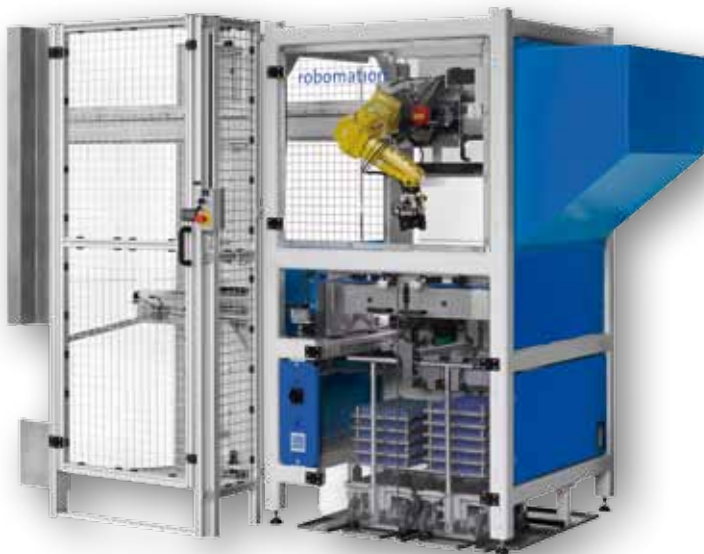
SECKLER robomation LM100