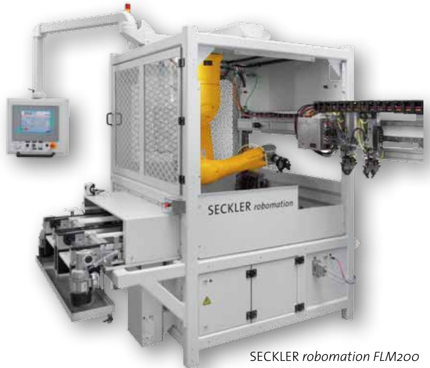
SECKLER robomation FLM200