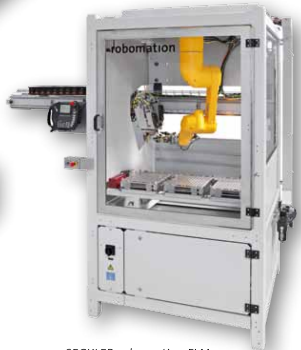
SECKLER robomation FLM100