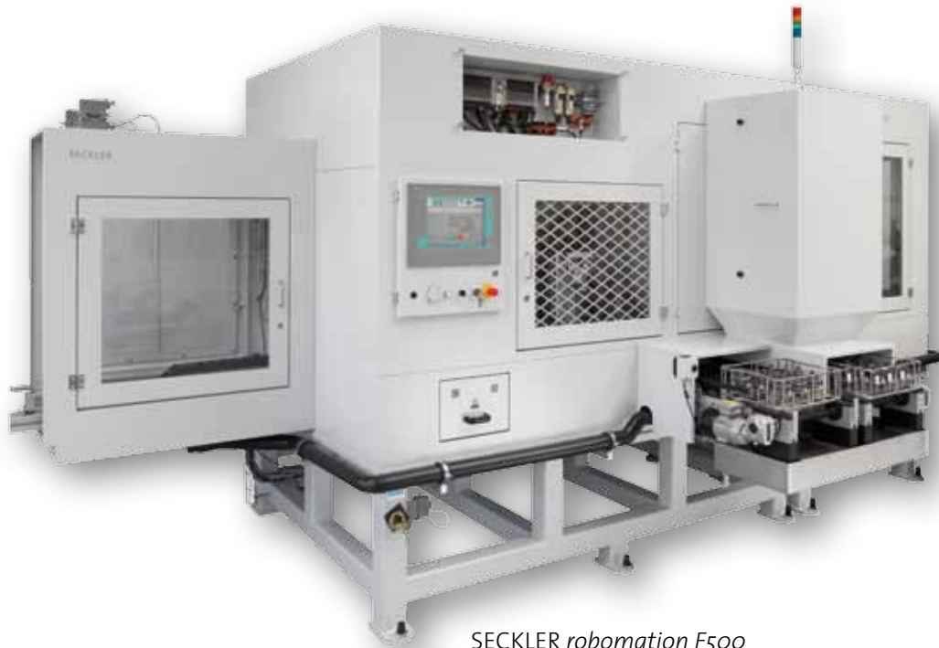
SECKLER robomation F500

Falls Sie noch höhere Traglasten bzw. eine längere Reichweite benötigen steht Ihnen unsere robomation 500 zur Verfügung.