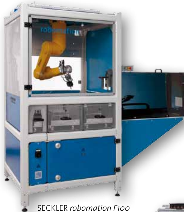
SECKLER robomation F100